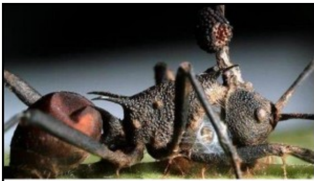
【电子禅堂】恐怖的僵尸真菌 人类得好好研究研究这些看不见的微生物了，不要有一天它们劫持了我们的大脑。（大象 20151204 dianzichan.com）

众所周知，我们的消化道存在大量的微生物，没有它们，我们吃下去的东西可能会原封不动排出来，不会消化吸收。我们离不开它们，所以叫它们益生菌。